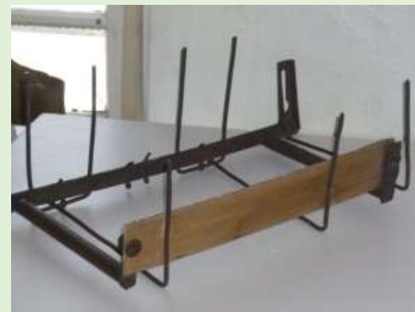
Фрагмент стеблеподъемника, сконструированного В.И.Морозовым в 1972 году

эксцентриковое мотовило, дали возможность беспрерывно поднимать полеглые хлеба к ножу жатки, вести косовицу на всей скорости и в двух направлениях и практически без потерь.